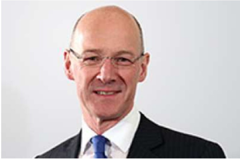
John Swinney, vara fyrstiráðharrí í Skotlandi