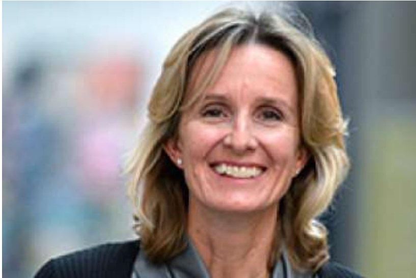
rene Rummelhoff, konsernstjóri hjá Statoil fyrí nýggjum orkuloysnum