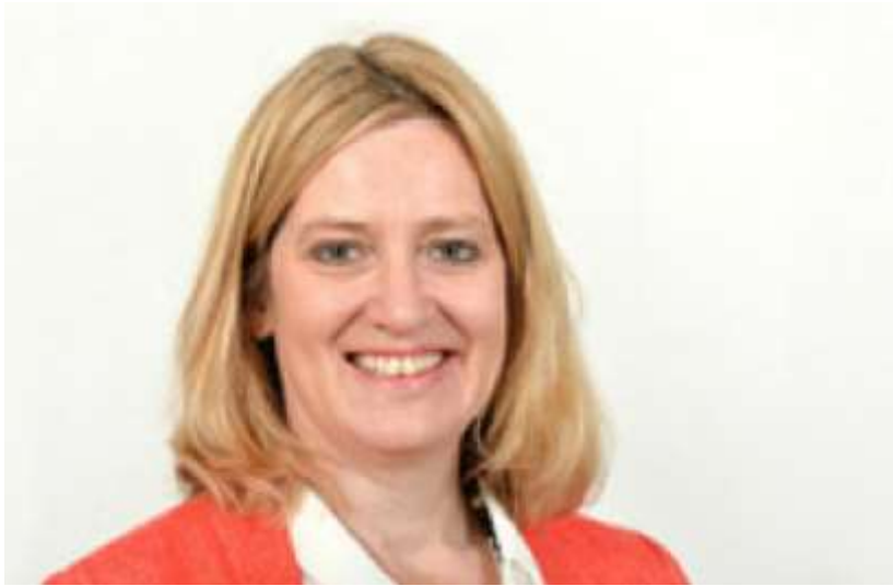
Amber Rudd, bretska orkuráðharrinn