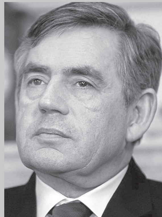
Gordon Brown mælir skotum frá at velja skotska tjóðskaparflokkinn

Í kanningini siga 77 prosent av teimum, sum kunnu arbeiða heima, at tey fáa minst líka nógv burturúr av at arbeiða heima sum á arbeiðsplássinum. Samstundis siga 86 prosent, at tey fáa minni strongd av at arbeiða heima enn á arbeiðsplássinum.