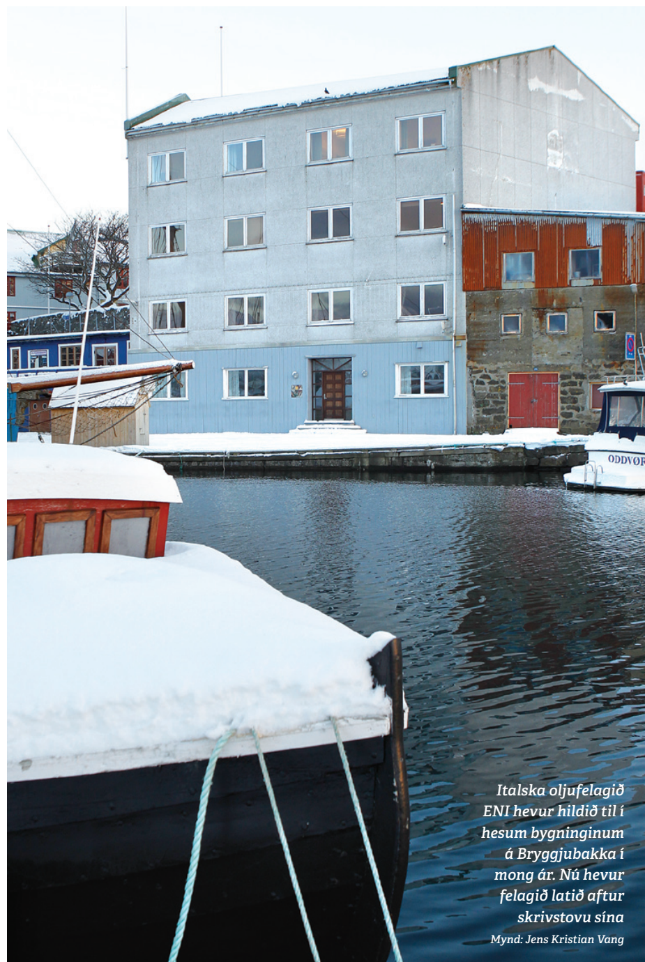
Ítalska oljufelagið ENI hevur hildið til í hesum bygninginum á Bryggjubakka í mong ár. Nú hevur felagið latið aftur skrivstovu sína