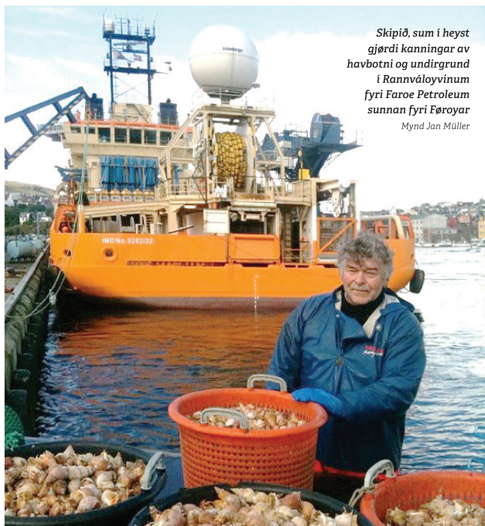
Skipið, sum í heyst gjørdi kanningar av havbotni og undirgrund í Rannváloyvinum fyrri Faroe Petroleum sunnan fyrri Føroyar