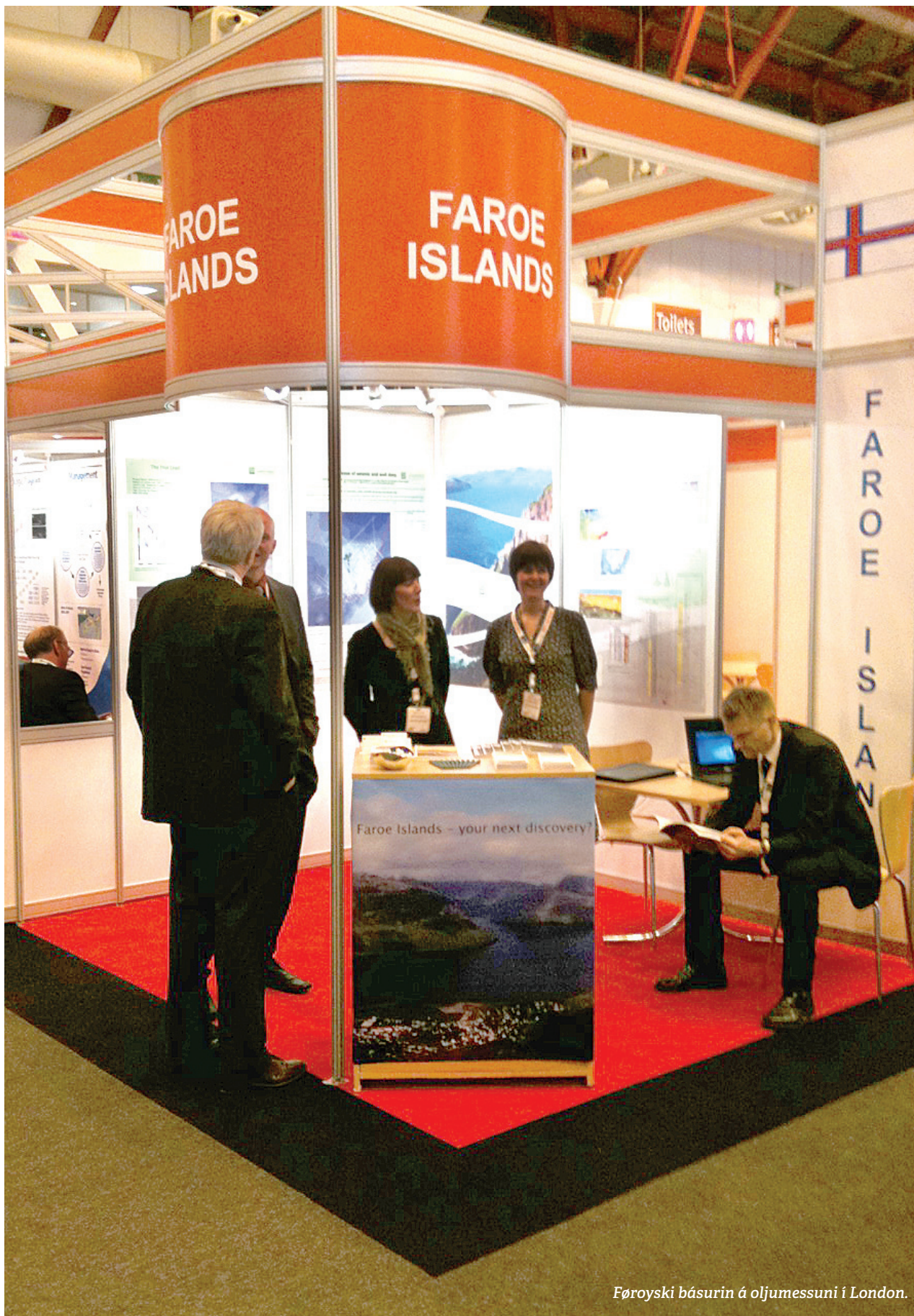
Føroyski básurin á oljumessuni í London.