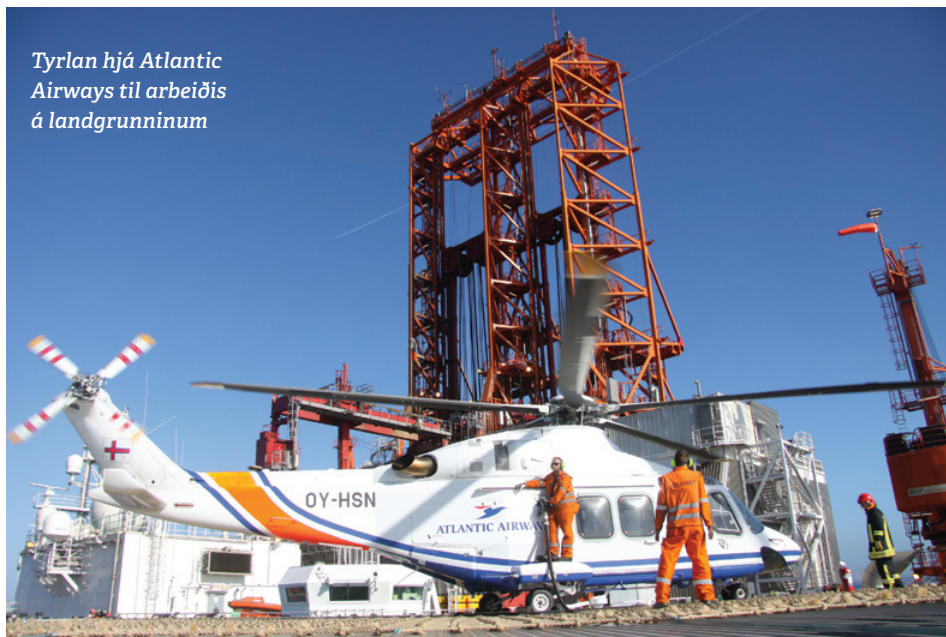
Tyrilan hjá Atlantic Airways til arbeiðis á landgrunninum

Hóast vit skulu vera realistisk og hvørki undir-ella yvirmeta úrslitið av einum brunni sum Anne Marie í verandi støðu, so er tað eisini skeivt at koma til ta niðurstøðu