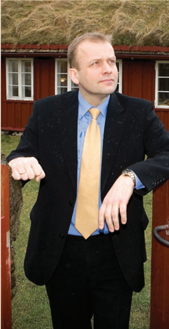
Løgmaður spentur um sjeýnda brunnin