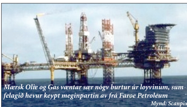
Mærsk Olie og Gas væntar sær nógva burtur úr loyvinum, sum felagið hevur keypt meginpartin av frá Faroe Petroleum

Herfyri keypti danska Mærsk Olie og Gas meginpartin av ein- um loyvi frá Faroe Petroleum, og felagið væntar sær nógva burturúr