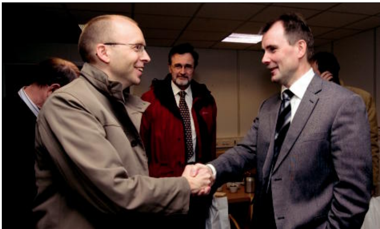
Umboð fyri StatoilHydro her á fundi við Jarðfeingi

Í tíðindaskrivi verður sagt, at felagið fekk 20