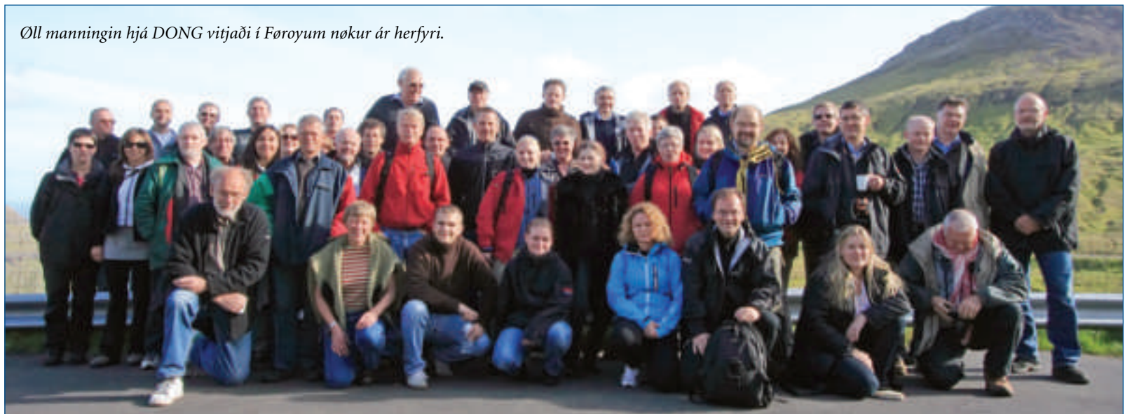
Øll manningin hjá DONG vitjaði í Føroyum nøkur ár herfyri.

Vit síggja loyvini, sum Dong eigur lut í millum Føroyar og Hetland. Miðskeiðis millum Hetland og føroyska markið fer felagið at bora ein gassbrunn í summar. Sírkulinn miðskeiðis á kortinum vísir økið, har Dong fer at bora í summar. Hetta liggur rættiliga tætt upp at Laggan gassfeltinum