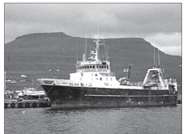
Fimm av seks monnum við Sancy verða føroyingar

Sancy er farin úr føroyska fiskiskipaflotanum fyri Beinissvørð hjá Sancy Trawl, sum er keyptur úr Íslandi, og nú verður gamli djúpvatnstrolarin riggaður til oljuvinnu, samstundis sum Beinissvørð verður riggaður til fiskiskap.