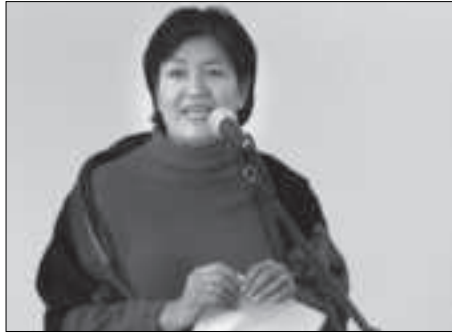
Aleqa Hammond fer í stríð fyri kópaskinnini

Um einar fjúrtan dagar fer ES-tingið at viðgera eitt uppskot um, at samveldið skal banna øllum handli við kópaskinum. Verður uppskotið samtykt, fer tað millum annað at bera í sær, at ES gevst at innflyta kópaskinn. Uppskotið hevur vakt stóran ans í Grønlandi. Aleqa Hammond, landsstýrskvinna í uttanríkispolitiskum viðurskiftum, sigur við KNR, at tað fær sera álvarssamar avleiðingar í Grønlandi, verður uppskotið samtykt.