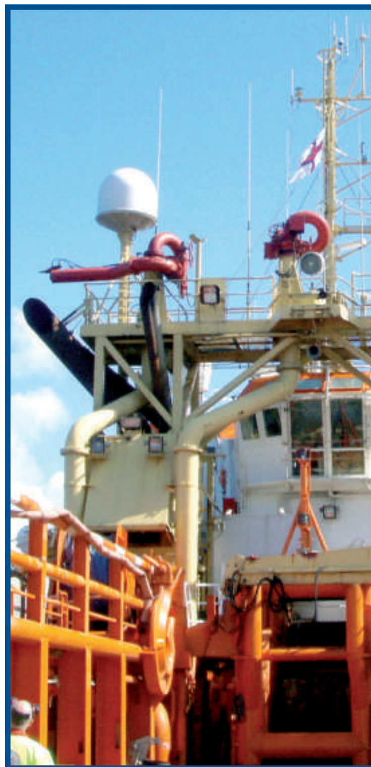
Føroyska manningin við teimum størri skipunum telur 10, og seks føroyingar eru við hvørjum av teimum smærru skipunum, sum Tor Shipping rekur undir føroyskum flaggi

Manningin á Prosper heldur tað vera sera spennandi at starvast í norsku oljuvinnuni, og teir eru væl nøgdir