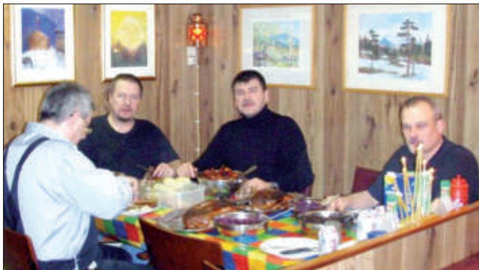
Jóladøgurðin er á borðinum, og jólagávur eru komnar frá Sjómanskvinnuringum og reidari

Manningin á supply/standby-skipinum Prosper, sum siglir undir føroyskum flaggi, heldur tað vera sera spennandi at starvast í oljuvinnuni. Teir eru væl nøgdir við sitt arbeiðspláss og sín arbeiðsgevara, sum er Tor Shipping. - Vit eru 28 dagar umborð og 28 í landi. Hetta er gott sjólv og góðar umstøður, tá tú hevur tína familju heima í Føroyum, siga teir