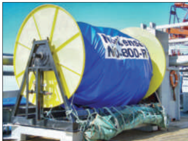
Prosper hevur oljusperring umborð, um olja fer at leka í feltinum

við sitt arbeiðspláss og sín arbeiðsgevara.