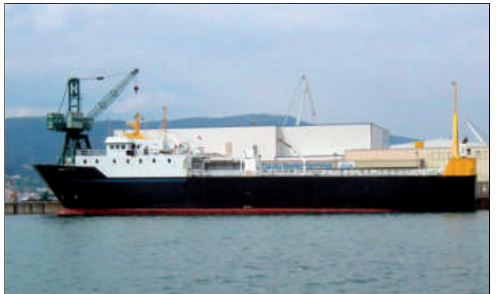
Silver Fjord fer at sigla til Scrabster tvær ferðir um vikuna

Nú Faroe Ship gevst at sigla millum Føroyar og Scrabster, hava føroysk feløg stovnað nýtt farmafelag, sum kemur at sigla til Skotlands við kølifarmaskipinum Silver Fjord