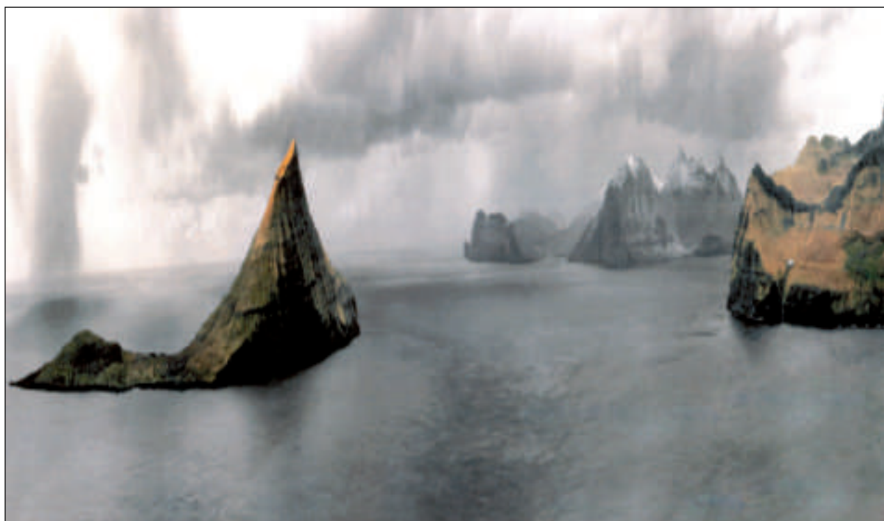
Faroe Petroleum kennir seg sum eitt slag av handilsvindeygad úteftir - har tað roynir at fáa útlendsk oljufelag hermillum japanskt at venda eyguni og ilögurnar móti leiting í Føroyum og økinum her í Atlantshavi