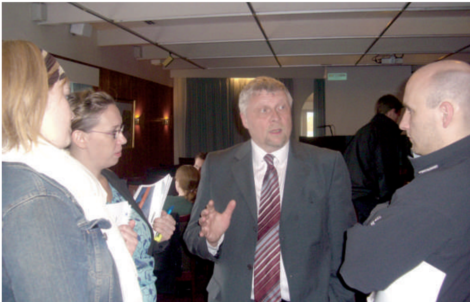
Umboð fyri figgingarstovnar tosa við umboð fyri Faroe Petroleum

brunnarnar. Ein brunnur kann kosta millum 200 og 500 mill. Kr. Tað eru nógvir pengar serliga í dag, har kappingin er hørð um bori-pallar. Eg sjálvur haldi ikki tíðin er tann rætta enn at hava eitt alment føroyskt oljufelag.