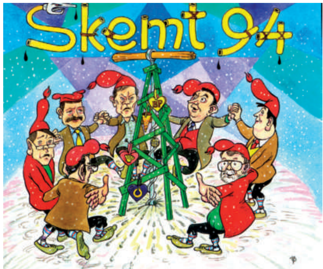
Longu fyri skjótt fimtan árum síðani teknaði Óli P boring hjá BP og Shell. Kelda Skemt 94