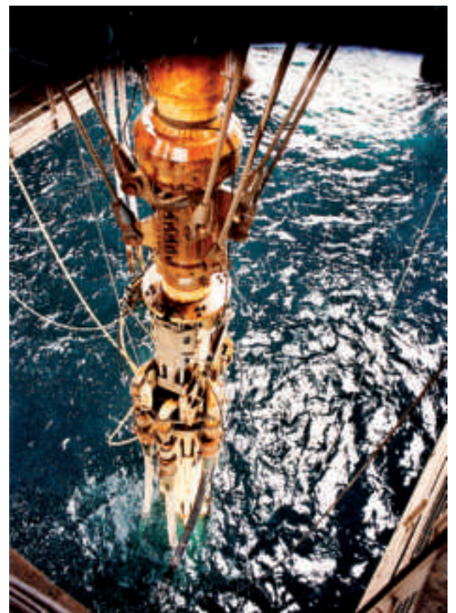
Nú er stóri spurningurin, hvørji oljufeløg eru sinnað til at taka proppin úr Williambrunninum og bora víðari

Alt hetta fær okkum at spyrja, hví føroyskir oljuyndugleikar hava gingið við til, at brunnurinn "bara" skuldi borast niður á 3.350