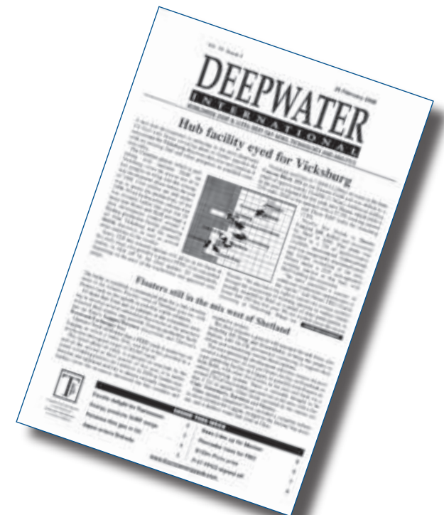
Deepwater International, eitt av teimum mest seríøsu altjóða oljublødunum umrøður spennandi framtíðina hjá økinum vestan fyrri Hetland á forsíðu.

So tað kann óivað væl hugsast, at nú sannlíkindini eru størri og størri fyrri, at Rosebankfeltið verður fult