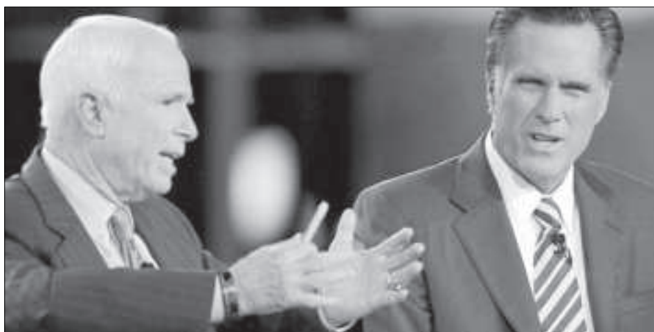
John Mc Cain og Mitt Romney fara kanska at stilla upp sum forseta- og varaforsetaevni

Tann 71 ára gamli John McCain hevur vunnið sær rættin til at stilla upp fyri republikanska flokkin á amerikanska forsetavalinum í novembur. Men tann spurningurineisini áhuga verður, siga amerikanskir fjølmiðlar og vísa á, at aldurin og hansara serstöða í ymsum málum gera, at hann noyðist at finna sær tað rætta evnið til varaforseta. Ja, summir fjølmiðlar halda, at varaforsetavalið