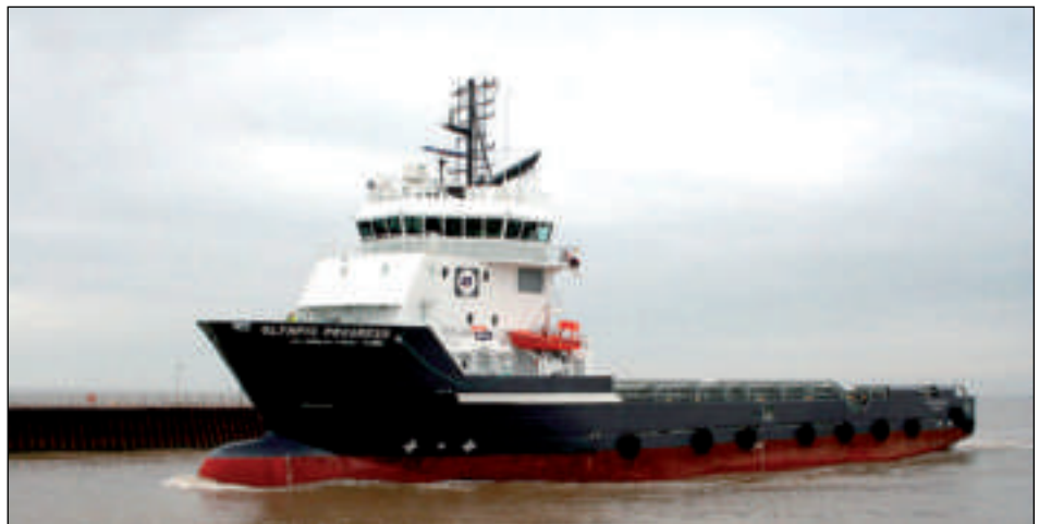
Norska veitingarskipið Olympic Progress siglir millum havnar í Egyptalandi og triggjar boripallar, sum eru fáar tímar úr landi

ir upp á at vera her í hitanum í 2008. Hetta er eitt nýtt kapitull hjá hesum báðum sympatisku føroyingunum, ið norsku starvsfelagarnir halda sera nógv av, skrivur John Moltu, sum er HMS-motivator hjá Olympic.