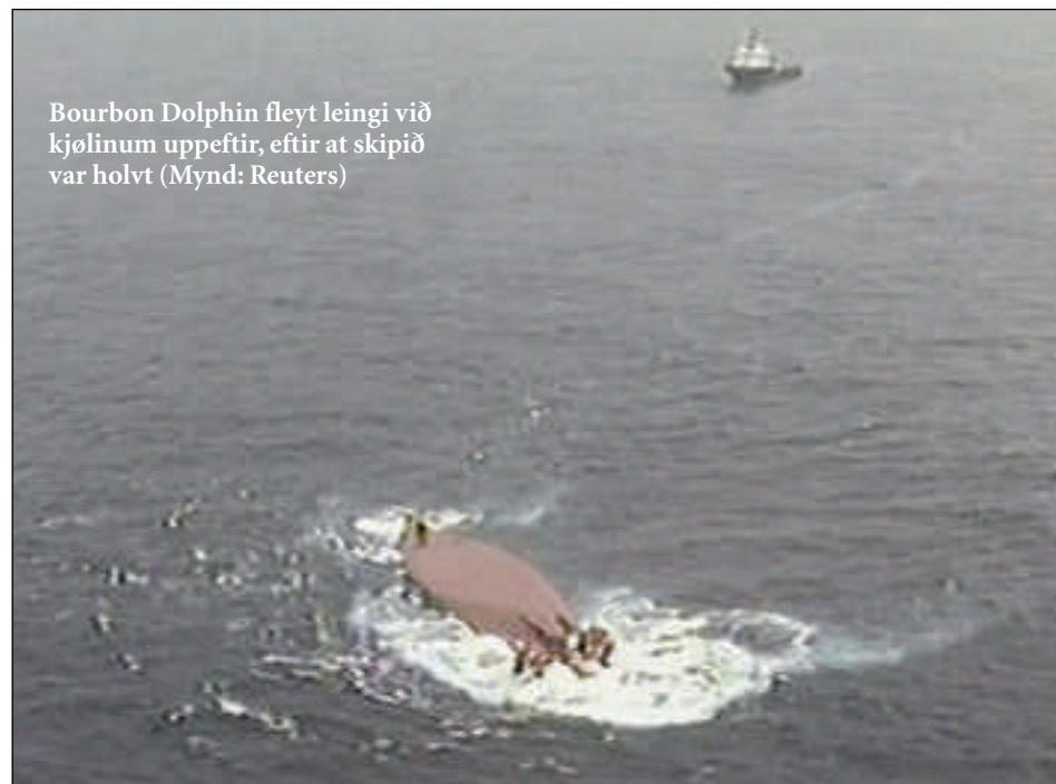
Bourbon Dolphin fleyt leingi við kjølinum uppeftir, eftir at skipið var holvt

Vrakið av norska veitingarskipinum verður eftir øllum at døma liggjandi á botni millum Føroyar og Hetland