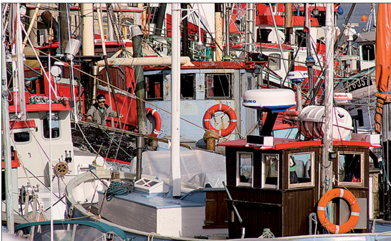
Um fá ár verður námsvinna størri vinnugrein í Grønlandi enn fiskivinnan

Urguleikarafelagið bleiv stovnað fyri 5 árum síðani. Í tí sambandi hevur felagið í dag sent út eitt tíðindaskriv, eitt slag av statusrapport, sum tekur saman um. Endamálið við Urguleikarafelagið byrjaði sítt arbeiði við at gera uppskot um gjald til urguleikarar. Hetta uppskot bleiv sent Mentamálaráðnum, men hevur felagið einki frætt síðani. Felagið fer í komandi ári at biðja um ein fund við kirkjuráðini, har hugt verður eftir starvslýsingum fyri urguleikarar. Urguleikarafelagið fer at heita á kirkjuráð við størri kirkjum, um at gera sáttmála við sínar urguleikarar. Arbeiðið, at kanna møguleikarnar fyri at taka urguleikaraprógv í Føroyum á ymiskum stigum, er í gongd. Vit miðja ímóti, at flestu urguleikarar í Føroyum um eini 2-3 ár hava tikið eitt urguleikaraprógv á grundstigi, skrivur Urguleikarafelagið millum annað í tíðindaskrivi.