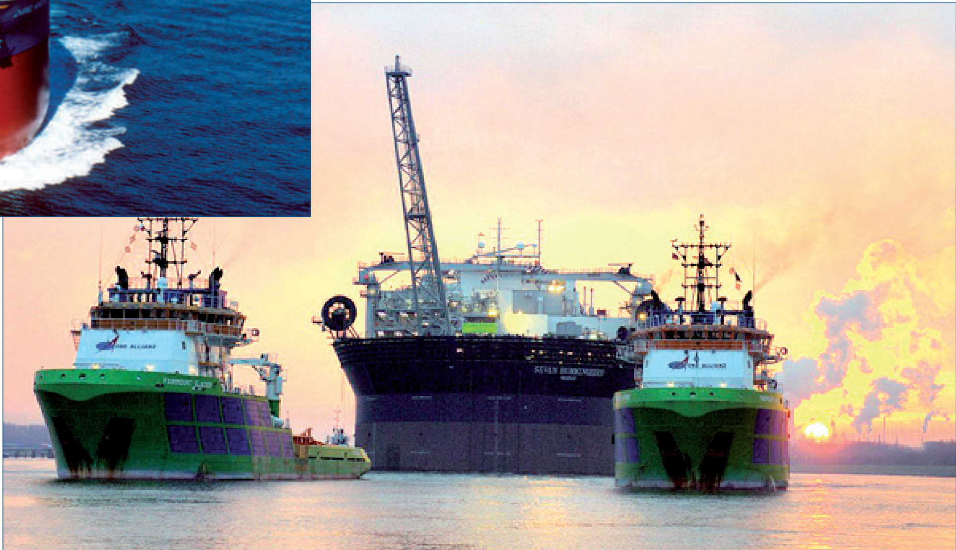
Atlantic Petroleum var besta partabrævið á danska partabrævamarknaðinum í 2007. Úrtøkan til partaeigarar var 249%

Tað, sum er umráðandi, er, at íleggjarar duga at vísa varni og skynsemi og spjæða iløgurnar meira enn nakrantíð, nú ið ótryggleikin á virðisbrævamarknaðinum sum heild tykist at verða størri enn hann hefur verið tey seinastu 3-4 árin.