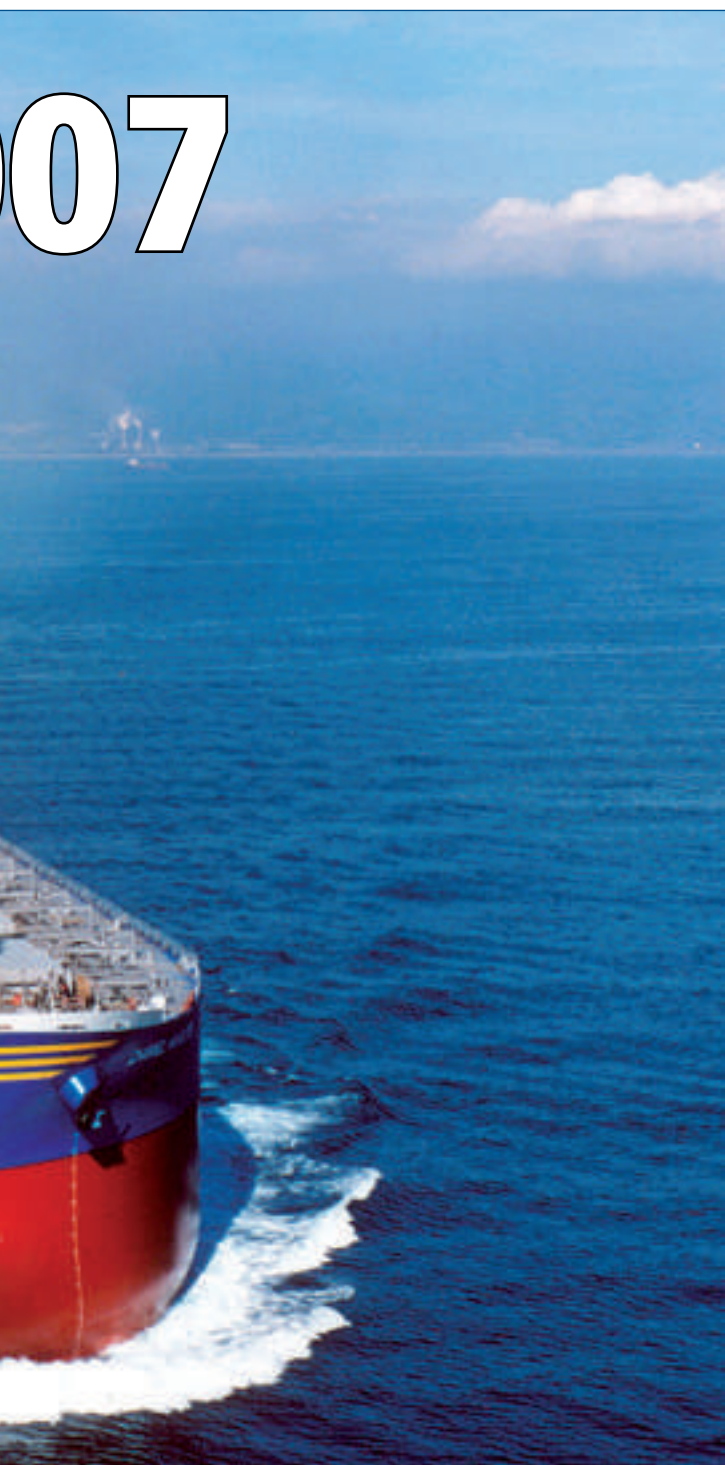
Tað skuldi vísa seg at gerast ein gylt iløga at keypa partabrev í norska farmaflutningsfelagnum Golden Ocean í 2007, har úrtøkan til partaeigarar var omanfyri 200%. Myndin: Eitt av mongu farmaskipunum hjá Golden Ocean, Channel Navigator

Nýggj kanning sigur, at tað er best fyri bæði teg sjálvan og starvsplássið, um tú arbeiðir heima. Kanningin frá Pennsylvania State University er almenna kunngjørd í Journal of Applied Psychology tekur saman um 46 kanningar, um úrslitið av at arbeiða heima við hús. Og úrslitið er betur enn væntað, skrivir Politiken. Fólk flest eru soleiðis innrættað, at tey fáa mest burtur úr, tá tey ikki sita á skrivstovuni. Tá sleppa tey undan telefonum, sum ringja í tíð og ótíð, og øðrum sum annars órógvur eitt arbeiðspláss. Ágóðarnir av at arbeiða heima eru fleiri. Økt framleiðsla er eitt, men eisini eru fólk betur nøgd við arbeiðsplássið, og samstundis verða tey ikki eins strongd av stríðnum í at fáa familju- og arbeiðslív at hanga saman.