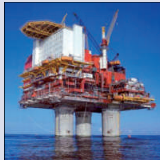
Økt vælferð í stórum londum sum Kina, India og Ruslandi økir eftirspurningin eftir olju og trýstir prísir upp