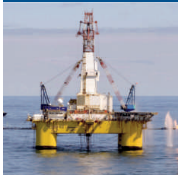
Transocean Rather, sum hevur borað í góðan mánað

Frá boringini hjá Statoil á Brugdleiðini í fjør fingur vit staðfest, at tað gekk væl skjótari at bora gjøgnum basalt enn metti. Nú fáa vit so at síggja, hvussu leikur fer fram á Williamleiðini.