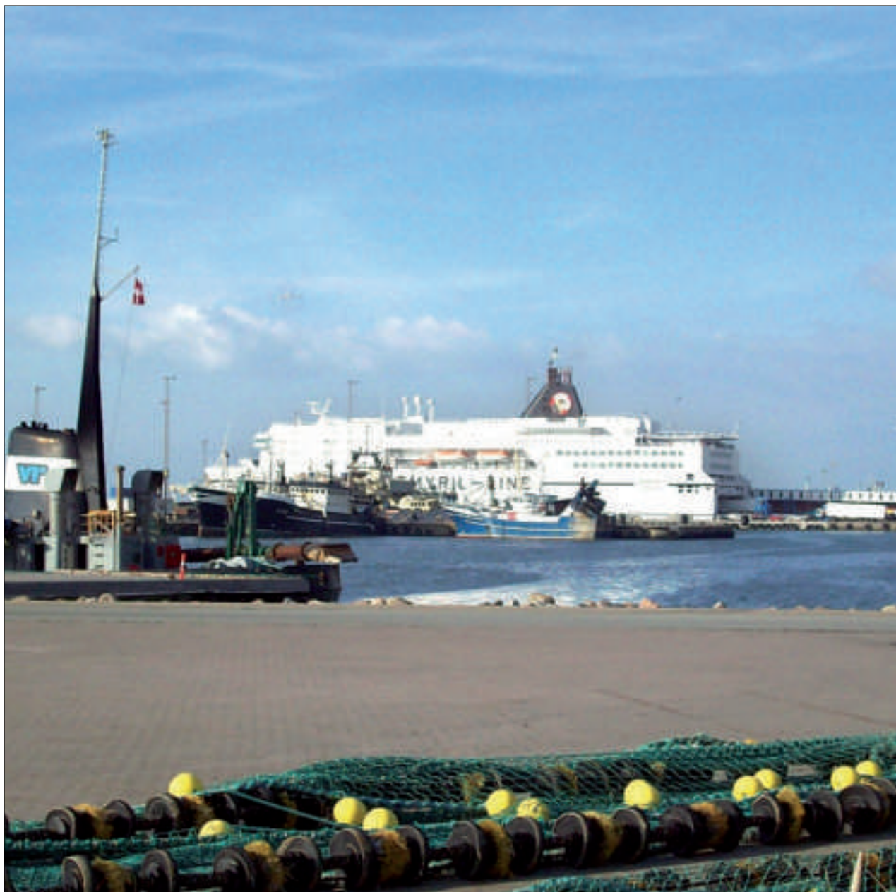
Norrøna fær ivaleyst fleiri ferðafólk millum Bergen og Hanstholm, nú Color Line gevst at sigla