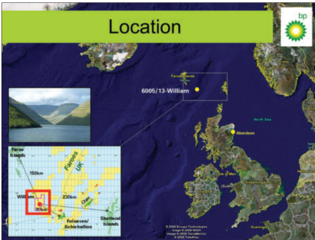
Williambrunnurin er sætti brunnurin, sum verður boraður við Føroyar. Kort BP

Williambrunnurin er eitt samstarv millum tveir av