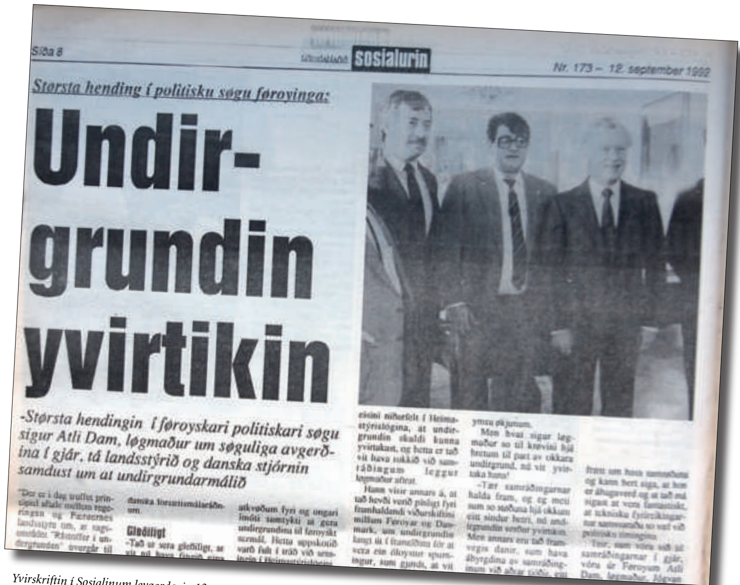
Yvirskriftin í Sosialinum leygardagin 12. september 1992: Størsta hending í politisku søgu feroyinga: Undirgrundin yvirtikin