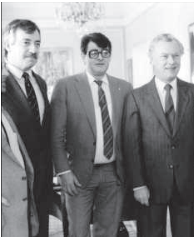
Tríggir av høvuðsperónunum sum vóru við til samráðingarnar, tá avtalan varð gjord um yvirtøku av undirgrundini tann 11. september 1992, f.v.: Uffe Ellemann Jensen, uttanríkisráðgjafi, Atli P. Dam, løgmaður, og Poul Schlüter, forsætismálaráðgjafi

stjórnini stóð m.a. »Der er i dag truffet principiel aftale mellem regeringen og Færøernes landsstyre om at sagsområdet "Råstoffer i