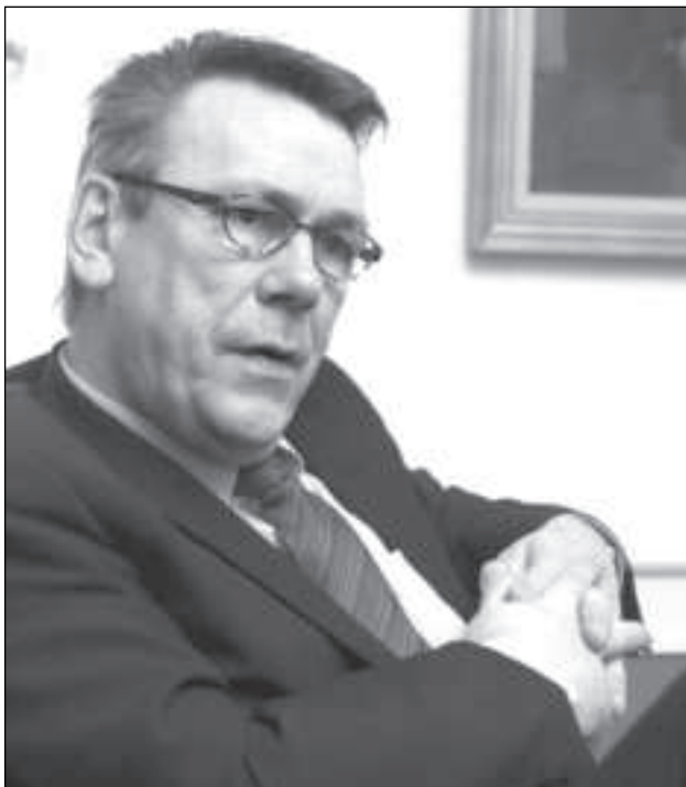
Løgmaður fer at geva sitt íkast til at altjóða oljувinna og fíggarheimur fara at vísa feroysku oljutilgongdini í framtíðini.