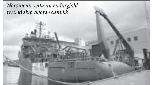
Norðmenn veita nú endurgjald fyri, tá skip skjóta seismikk

Vit vildu helst avmarka seismikkun so nógv sum gjørligt, men bæði oljufeløg og fiskiídnaðurin skulu liva saman. Og samanlíknar vit við støðuna í Norðsjónum, eru vit komnir væl á leið. Í