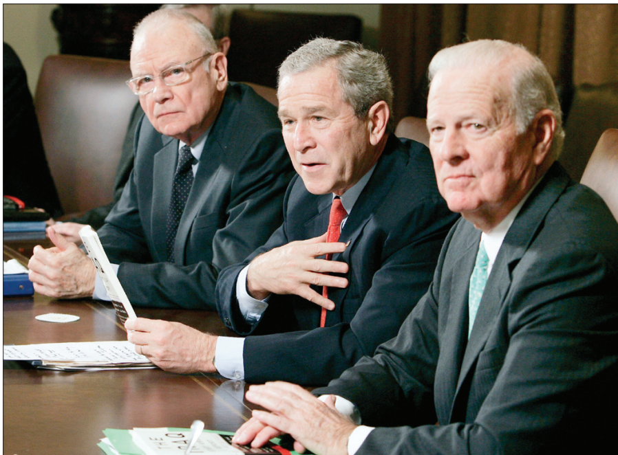
George W. Bush, forseti, ímillum teir báðar leiðararnar í Baker-nevndini, Lee Hamilton og James Baker.

– Bush tykist hava gjørt av at spæla leiklutin sum ein Winston Churchill í