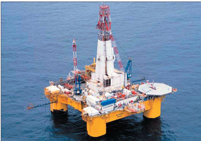
Vit koma at hoyra nógv til henda boripallin komandi árið. Transocean Rather hevur júst sett borin í Rosebankleiðina skamt frá markinum, og tá hann er liðugur har í vár gongur leiðin inn á føroyska landgrunnin at bora Williambrunnin.