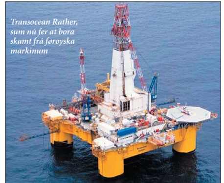
Transocen Rather, sum nú fer at bora skamt frá føroyska markinum

Tað snýr seg um at bora triggjar avmarkingar og metingarbrunnar í sambandi við eitt fund, sum varð gjørt fyrri tíð síðani. Millum oljufólk verður mett, at talan er um eitt sera stórt fund og skulu komandi brunnarnir siga okkum, hvussu stórt tað er. Tað áhugaverda er, at oljukeldan liggur inni í sjálvum basaltinum. Tað fingur vit at vita á oljuráðstevnuni í Føroyum herfyri.