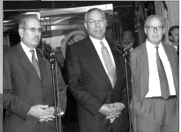
Mohamed El Baradei aðalstjóri í IAEA, Colin Powell, fyrr. uttanríkisráðharri í USA og Hans Blix

Vit skulu læra at liva saman, tí má heimssamfelagið mennast