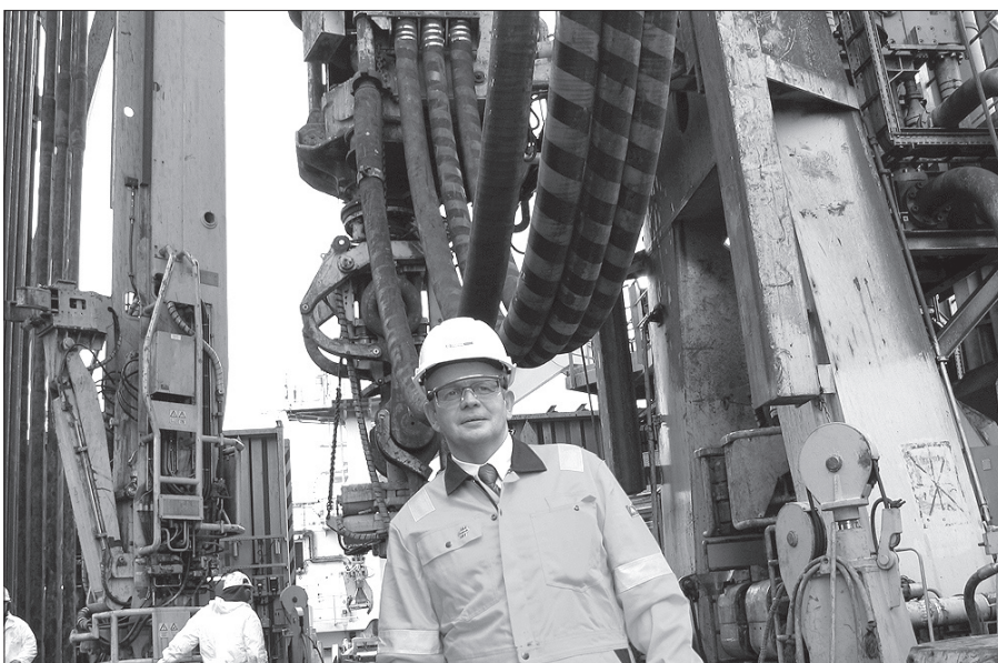
Herfyri vitjaði landsstýrismadurin í oljumálum umborð á Stena Don

Hetta er eisini tað, sum er vanligt fyri nógvar aðrar brunnar, sum verða boraðir. Enn er so kortini eisini ein vón um, at okkurt skal henda teir seinastu metrarnar niður í undirgrundina. Og enn er sum skilst eisini ov tíðliga til at gera endaligar niðurstøður um, antin kolvetni er til