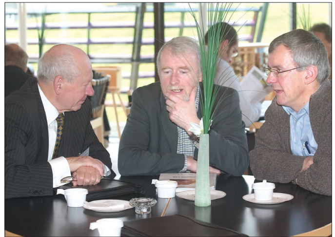
Frá oljuráðstevnu í Norðurlandahúsinum í morgun

Sambart fyrilestrinum á oljuráðstevnuni í Norðurlandahúsinum í morgun, halda serfrøðingar, at møguleikar eru fyri at finna sediment undir basaltinum av sama slag, sum eru funnin í Eysturgrønlandi. Ein staðfesting av hesum vilja vera góð tíðindini fyri øll, sum hava vónir til at finna kolvetni í føroysku undirgrundini. Jarðfrøðiliga søgan sigur okkum, at einaferð vóru Føroyar og Grønland grannar og við tíðini hevur Grønland flutt seg longur vestureftir.