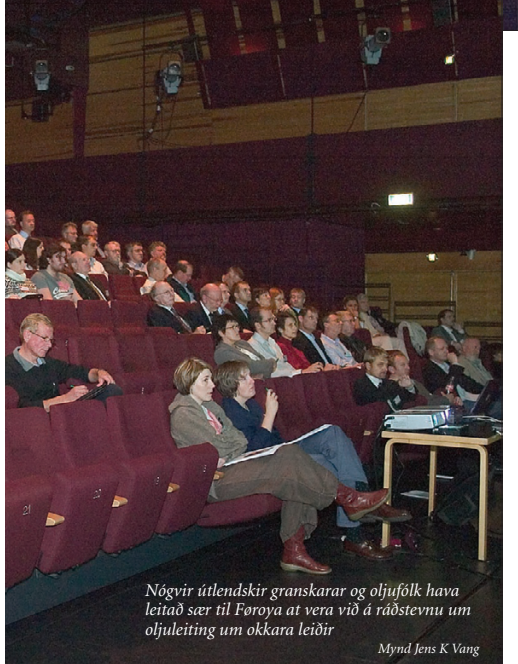
Nögvir útlendskir granskarar og oljufólk hava leitad sær til Føroya at vera við á ráðstevnu um oljuleiðing um okkara leiðir