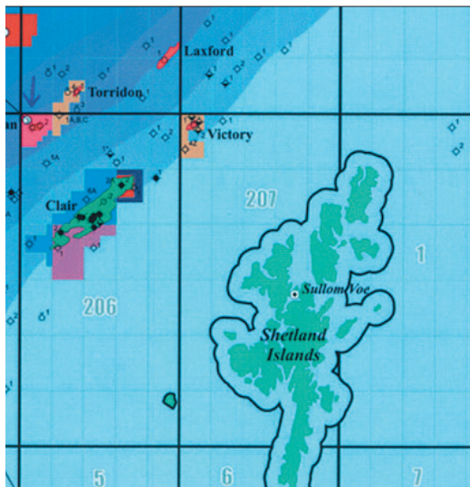
Kortid vísir seks ára loyvini, sum vórðu latin í ár 2000 og sum nú ganga út.

leggja til rættis 3. útbjóðing á landgrunninum, og í tí sambandi fara tey hjá Jarðfeingi eisini at viðgera í hvønn mun loyvini ella partar av loyvunum frá 1. útbjóðing skulu vera við aftur í nýggjari útbjóðing. Og her er tað so greitt,