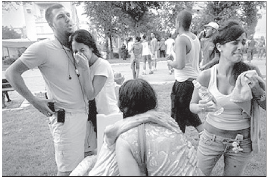
Ræðsluárin fólk í ísraelska býnum Haifa. Hizbollah-raketir hava fleiri ferðir rakt býin

– Ísrael gevur sína egnu grøv, um landið ger innrás í Libanon, sigur iranski forsetin.