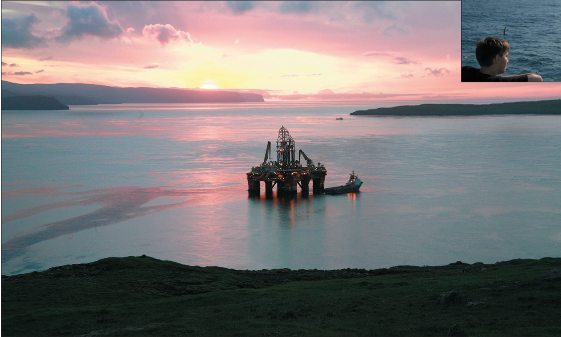
Stena Don tíðliga mánamorgunin, áðrenn hann legði leiðina til havs aftur