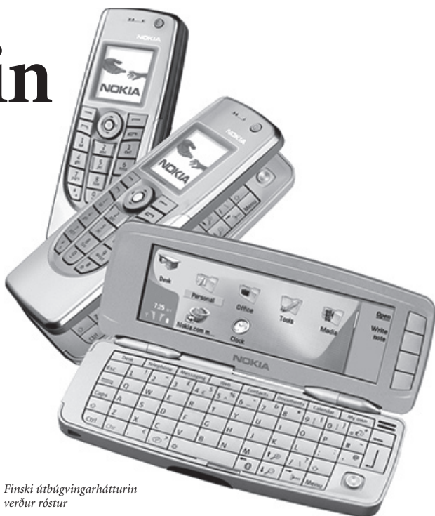
Fínski útbúgvingarhátturinn verður róstur

verða heilt í front. Fokus skal tá ikki bert verða á hægri útbúgvingar, men eisini tey fyrstu skúlaárin. Mett verður at tað er neyðugt at broyta tí stírvnu evropeisku skipanina, soleiðis at útbúgvingarstovnar gerast meira frælsir, og her verður Finland brúkt sum eitt gott dømi. Í stuttum verður sagt at útbúgvingarskipanin skal gerast smidligari, effektivari og lættari atkomilig hjá øllum.