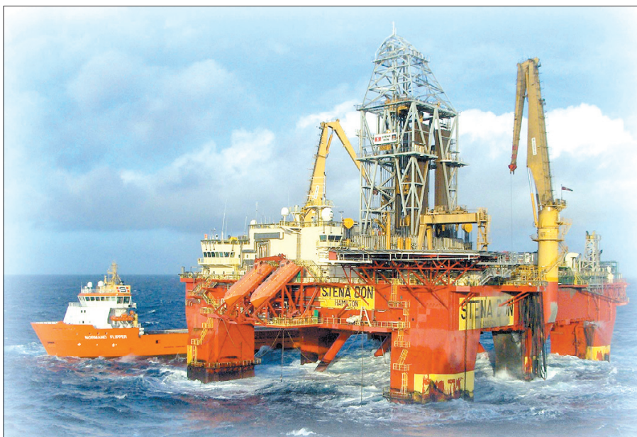
Stena Don, sum fer at bora Brugdubrunnin í summar