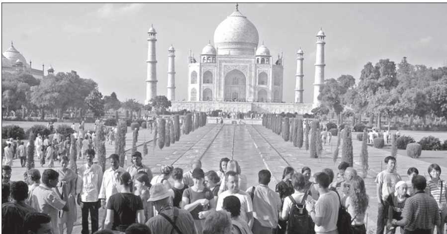
Taj Mahal í India

Stóra avbjóðingin liggur í at menna alt landið, tí munurin millum rík og fátøk er stórir, eins og at munurin millum sambandslandini er stórir, og at leisturin tey ynskja er ymskur. India er m.a. spennandi, tí talan er um ein sera stóran marknað við yvir einari milliárd íbúgvum. 2/3 arbeida enn í landbúnaðinum og nógva hava vánaligar liviumstøður. Búskaparvøksturinn er stórir, og um so er at miðalkeypiorkan veksur, gerst India ein av teim áhugaðverdu marknaðunum í heiminum, sum eisini hefur fingið staðfest sína tyngd, við at koma við í kjarnorkuklubban.