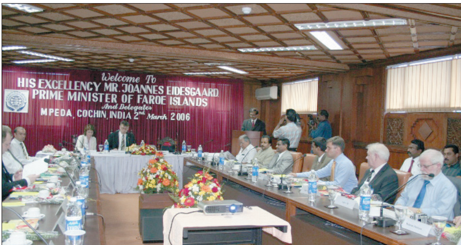
Nógvar varð gjørt burtur úr lögmanni og føroysku vinnulivsfólkunum í Cochin sum er høvuðs fiskivinnubýurin í India.

Føroya Tele stjórin sigur seg hava fingið nakrar sera positivar og spennandi kontaktir. – Hjá okkum er tað ikki so nógvar ein spurningur, um vit skulu innella útflyta nakað. Men harafturímóti at siggja, hvussu nógvar móguleikar eru fyrri partanaraskapi og samstarvi. Tað eru nógvar indiskar fyrirtøkur, sum arbeiða globalt. Tær eru sera opnar og eg havi kent tað so, at tær eru sera hugaðar fyrri samvinnu við okkum í Føroyum eisini. Enn er so einki undirskrivað, men eg skal ikki útiloka, at her fer at henda nakað.