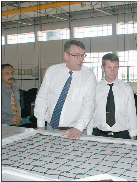
Løgmaður her saman við starvsfólki hjá Vónini, sum í løtuni er í indiskari netaverksmiðju og hevur eftirlit við arbeiðinum at gera partar av stórarí not