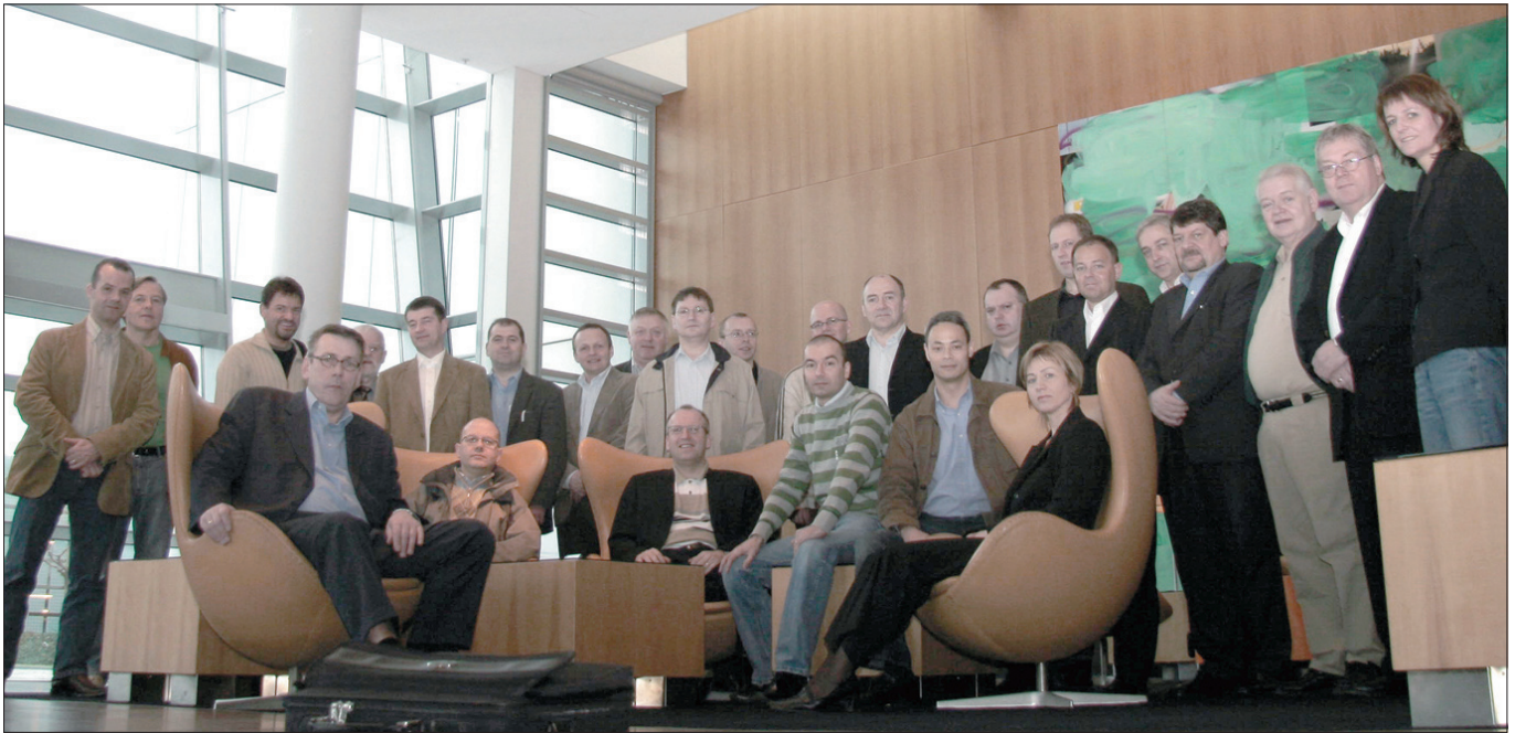
Her er føroyska ferðalagið á veg til India