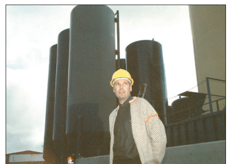
Oljuútgørdarhavnin í Runavík verður brúkt í komandi oljuleiting