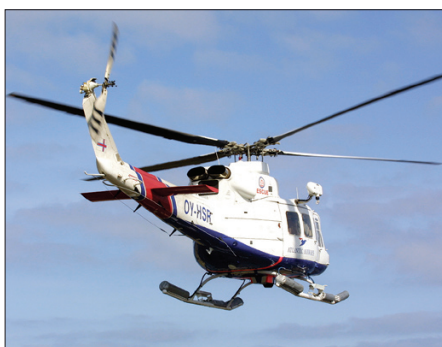
Brúk verður fyri oljuskípum og tyrlum í sambandi við boringina í summar