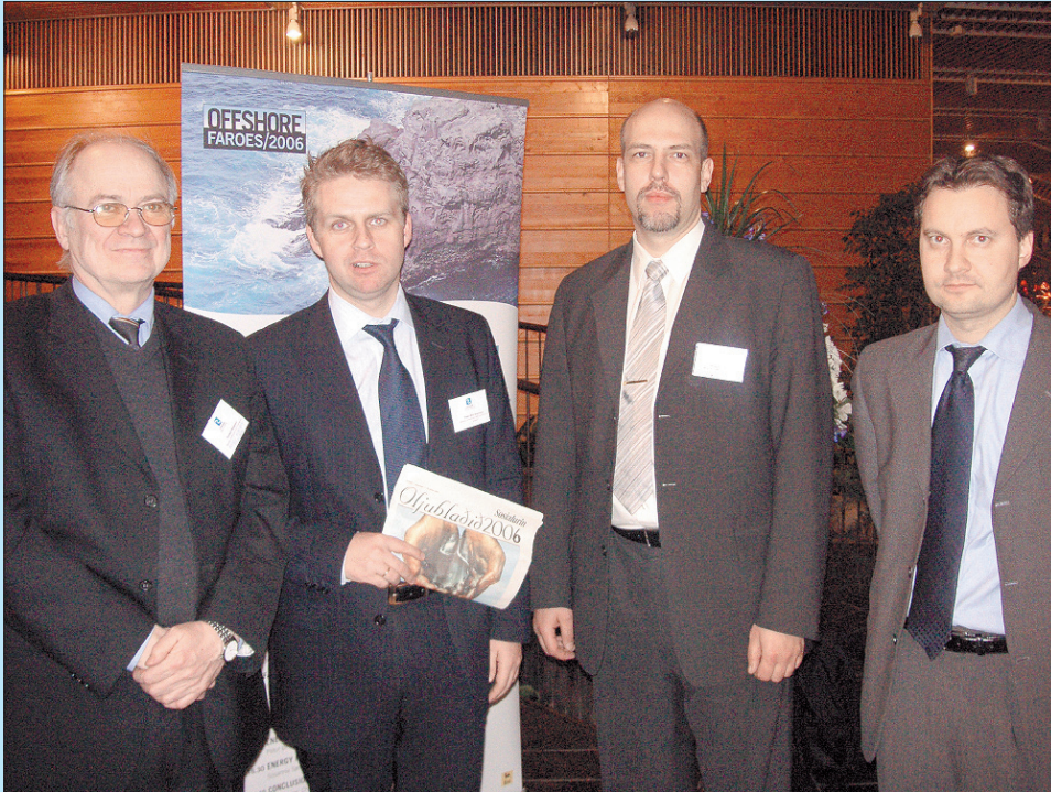
Fýra av umboðunum fyri íslenskar orku-vinnu- og umhvørvismyndugleikar her stóð á oljuráðstevnu í Norðurlandahúsinum.