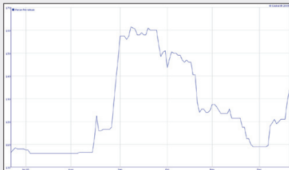
Sveiggini í kursvirðinum hjá Faroe Petroleum hava verið hampuliga stór seinasta hálva árið, sum táð eisini framgongur av talvuni

Við at fáa part í leitiloyvunum við Føroyar, hevur Faroe Petroleum tó gjørt eitt fitt lop upp eftir. At týðandi fund um sama mundið eru gjørd heilt nær føroyska markinum ger sjálvandi eisini sítt til, at vónirnar um eitt týðandi fund í Føroyum eru enn størri.