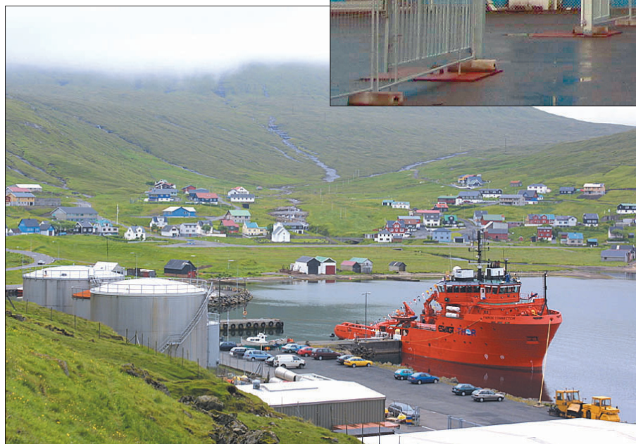
Thor í Hósvík hevur rættiliga gjørt vart við seg sum veitarar í oljuvinnuni kring um heimin

kring knøttin við sínum virkseimi. Á henda hátt kunnu føroysk feløg luttaka í oljuvirksemi alt árið.