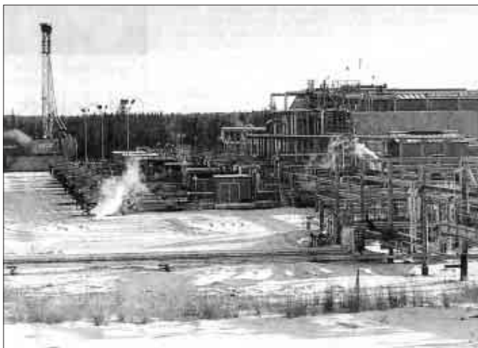
Oljuframleiðsla í Alberta

Í alt fer stjórnin í Alberta at geva 1.4 mia dollars beinleiðis til fólk. Oljukekkurin kemur ikki at ávirka aðrar inntøkur fólk