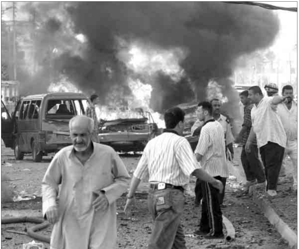
Sjálvmorðsbumbur hava verið gerandiskostir í Irak, síðani stýrið hjá Saddam Hussein fall

Sami Zubayda: "The rise and fall of civil society in Iraq" - á www.opendemocracy.net