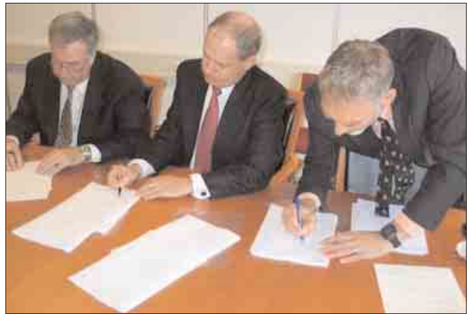
Umboð fyri oljufeløgini skrivað undir nýggju avtaluna

Føroyskir myndugleikar hava annars leingi sæð fram til, at okkurt oljufelag fór at bora gjøgnum basalt, soleiðis at vitan fekt um lögini undir basaltinum. Henda avtalan er so tann fyrsta av sínum slag. Og kann man siga, at hon er rættliga kolveltandi. Ein annar møguleiki kundi verið, at BP/Shell gjørd av als ikki at bora og heldur rindaðu føroyska lands-