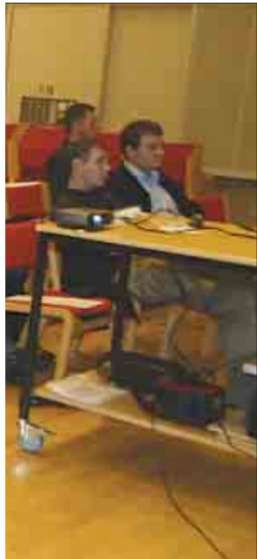
Stórir áhugi var fyri seminarinum, sum Farec skipaði fyri í útvarpshøllini

sum leverar umleið helmingin av oljuni hjá Saudi Arabiu. - Í Ghwar-feltinum hava teir stórar trupulleikar við at pumpa vatn fyri at halda trýstinum, so oljan fæst upp, men í Saudi Arabiu siga tey, at tað gongur fint!