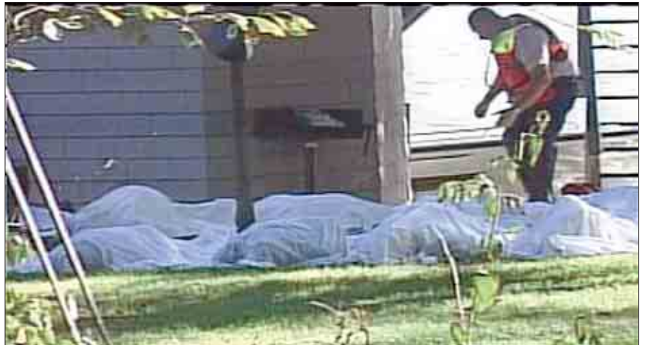
Minst 20, yvirhøvar pensjonistar, druknaðu, tá "Ethan Allen" holvdist

20 fólk druknaðu, tá ein ferðabátur holvdist á einum vatni í New York