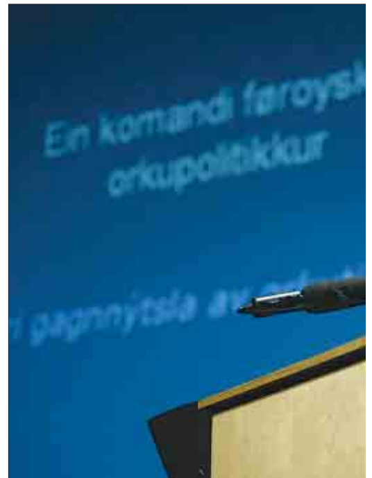
Bjarni Djurholm, landsstýrismaður í orku- og umhvørvismálum, greiddi frá

Hann vísti á, at vit í dag innflyta mest sum alla orku í formi av ymsum olju- dráttum, meðan ein minni partur av okkara orkutørv verður nøktaður av "heim-