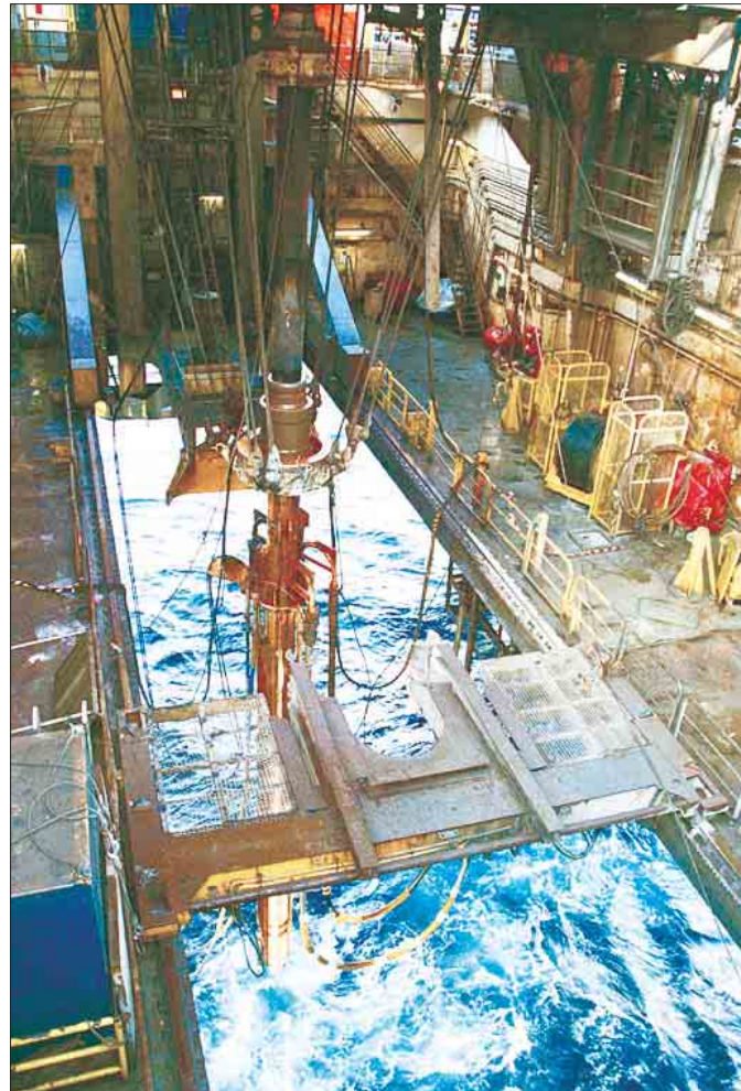
Næsta summer fer borurin eftir øllum at døma niður aftur í føroyska undirgrundina. Hesaferð gjøgnum basalt

Tá fyrsta útbjóðing á føroyska landgrunninum lat upp í 2000 buðu oljufeløg sær til at bora ikki færri enn 8 leitingarbrunnar. Síðani eru fyra av hesum brunnum boraðir í tí sokallaða "Gullhorninum",