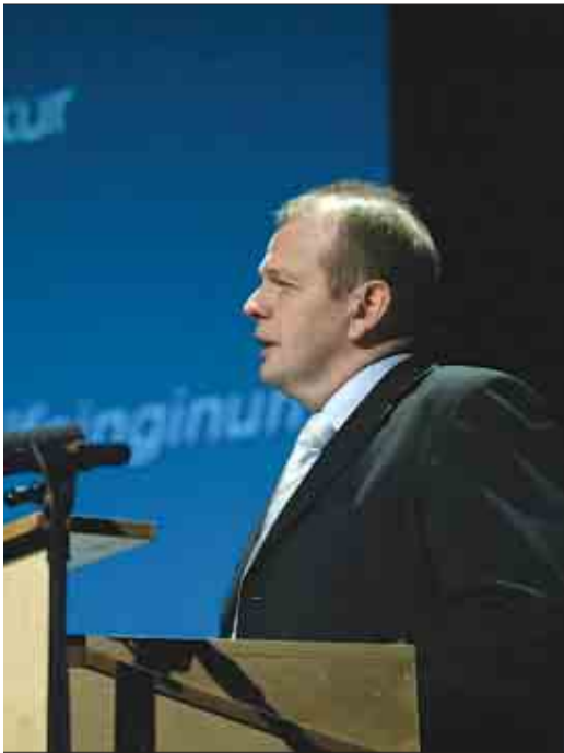
Ætlan landsstýrisins um orkupolitik og el-veitingarlóg