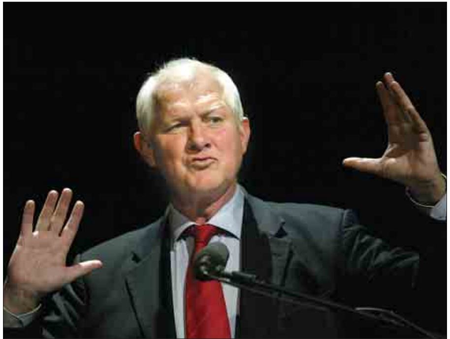
Tað var ein væl upplagdur fyrrverandi danskur orku- og umhvørvismálaráðharri, Svend Auken, sum helt fyrilestur í Norðurlandahúsinum mánadagin. Vit fara at venda aftur til fyrilesturin hjá honum í øðrum blaði