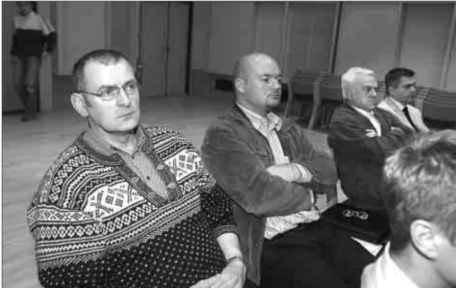
Umboð fyri vinnuna vóru við á seminarinum, og tey fylgdu við áhuga framløgum um útlitini um oljuprísirnar