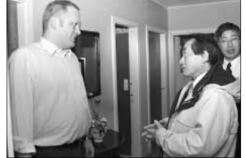
Sendiharrin hitti eisini umboð fyrri SNG, sum í fleiri ár hevur útflutt fiskavørur til Japans

– Hetta hevur verið ein sera upplýsandi túrur. Eg helt, at Føroyar lógu alt ov