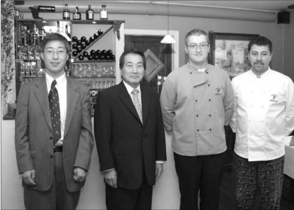
Japaniski sendiharrin og 1. Skrivarin her saman við góðum fólki á Merlot í Havn