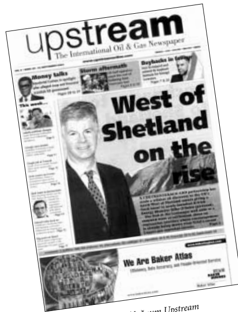
Forsíðan á altjóða oljubláðnum Upstream

Sosialurin hevur annars skilt, at eitt fund, sum er gjørt nakað sunnan fyri henda seinasta brunnin, møguliga er lönandi. Talan