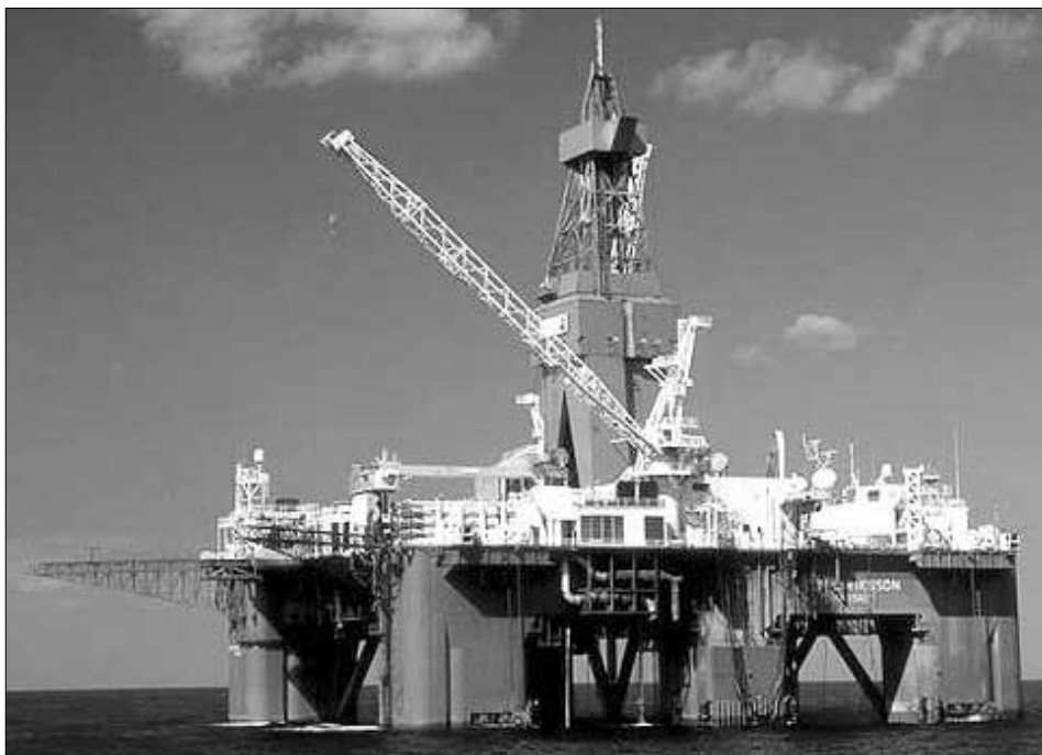
Eirikur Reyði er ein av heimsins størstu og best útjordu boripallum. Nú borar hann m.a. fyri føroyska oljufelagið Atlants Kolvetni.