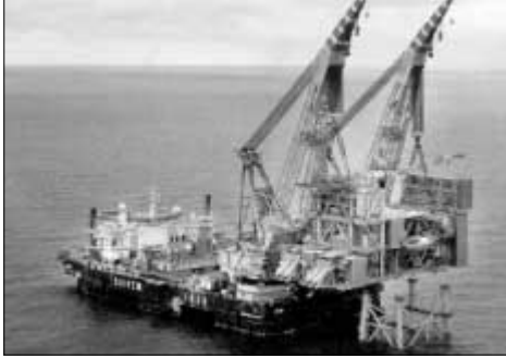
Oljupallurin, sum vigar 11.000 tons verður settur á beinini á Clairfeltinum vestan fyri Hetland. Ein nýggj epoka í oljuvinnuni á Atlantsmótinum. Mynd David Gold í BP blaðnum Horizon.

Um nakrar fáar mánaðir, móti endanum av hesum árinum, byrjar fyrsta oljuframleiðslan frá tí risastóra oljufeltinum Clair, vestan fyri Hetland. Hetta er størsta fundið, er gjørt á bretsku landgrunninum yvirhøvuð og varð fundið gjørt í 1978. Ikki fyrr enn nú 25 ár seinni hevur borið til við nýggjastu tøkni til at menna ein part av oljufeltinum. Talan er um eina iløgu uppá fleiri milliárdir kr. Fyri stuttum varð sjálvur oljupallurin fluttur út á feltið og settur á beinini. Talan er um eina konstruktión, sum vigar 11.000 tons. Hetta er samtiðis heimsins tyngsta konstruktión, sum er flutt á hjólum á landi nakrantíð. Oljupallurin er settur saman á skipasmiðjuni í Wallsend í Bretlandi. Tað er fyrirtøkan, AMEC, sum hevur staðið fyri arbeiðinum. Tað var serútgjörð kranabáturin Saipem