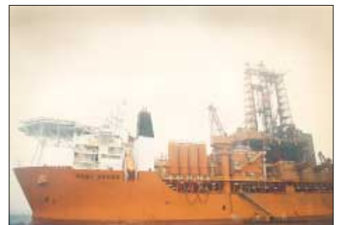
West Navigator, sum skal til at bora tveir brunnar skamt frá føroyska markinum í summar

Í august ella september í ár fáa vit so at vita, hvat flaggskipið í boriflotunum, West Navigator hevur funnið fram til. Verður eitt lønandi oljufund staðfest so tætt við føroyska markið tá, so fer tað uttan iva av álvara at seta Atlantsmótið aftur á altjóða oljukortið.