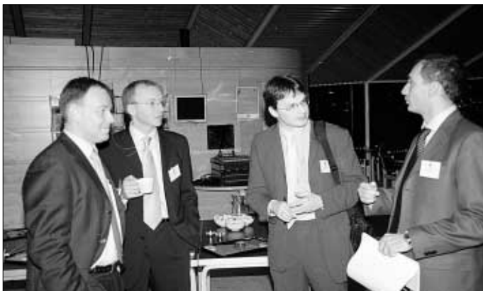
Hóast lítið og einki orðaskifti var og fáir spurningar settir á oljuráðstevnunni, so høvdu menn kortini nógv at tosa um í stæðginum. Her umboð fyri fleiri av oljufeløgnum, sum eru virkin á Føroyaøkinum

BP maðurin sigur at enda, at fyri teir er 2004 eitt analysuár, meðan 2005 verður eitt boriár hjá BP, báðumegin markið á Atlantsmótinum. Umframt tveir brunnar á føroyska landgrunninum hevur BP eisini bundið seg til at bora í bretska partinum av Atlantsmótinum.